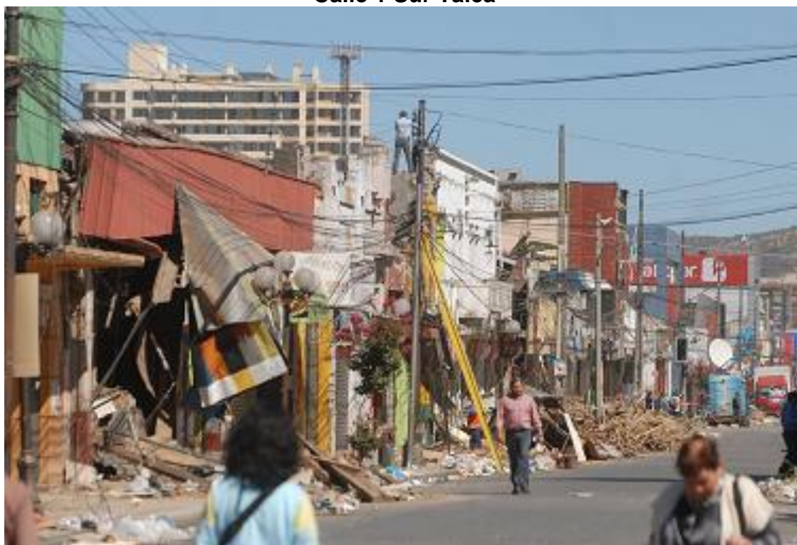
Calle 1 Sur Talca

La actividad organizada por la Junta de Adelanto del Maule contó con gran presencia de interesados que se informaron de los beneficios para reactivar sus fuentes de trabajo, gracias a préstamos blandos y a largo plazo.